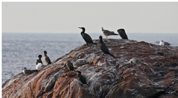
Corvos mariños e gaivotas empregan como lugares de descanso os numerosos cons que se atopan nesta parte da costa.