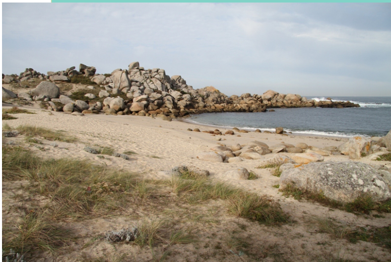
Praia e punta de Area Basta