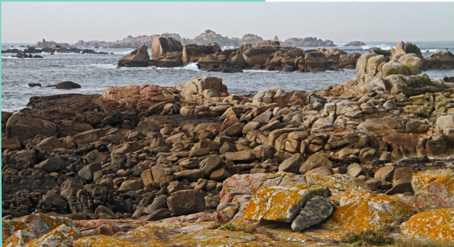
Boca norte da Ría de Arousa, entre a punta da Barca e a illa de Sagres. Unha das zonas complicadas para a navegación.