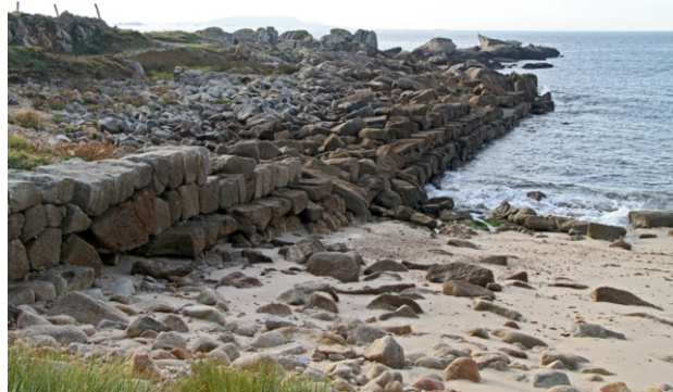
Restos do peirao fenicio da Covasa.