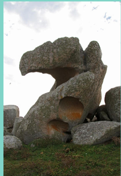
Algúns dos moitos penedos de formas curiosas