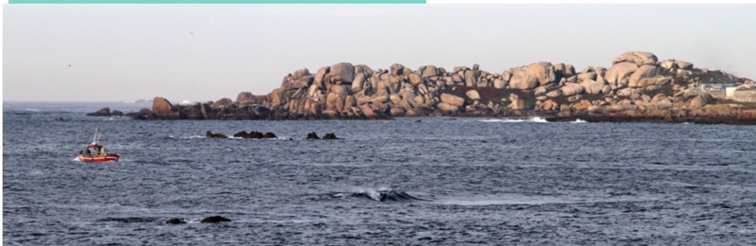
Vista da Punta Falcoeira desde a Covasa.