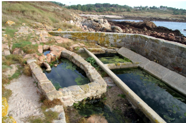
Lavadoiro á beira do mar