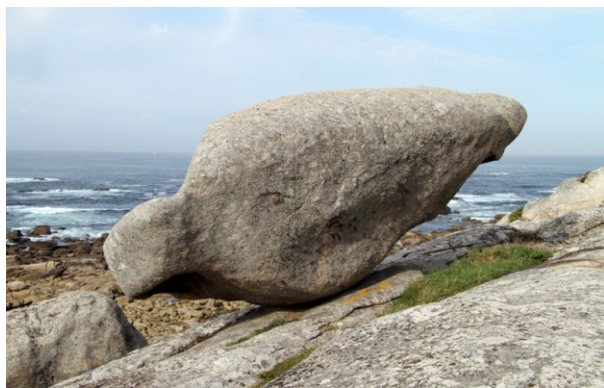
Unha pena do equilibrio